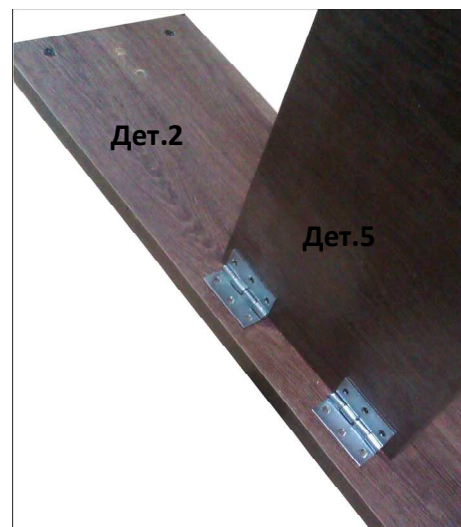
Схема установки карточной петли